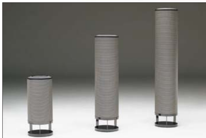
L470TX_(* ) + L470XX_(* ) + L470PX_(* ) lamps • Black & White