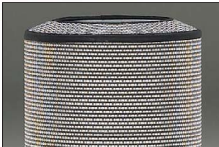
Black & White lampshade detail