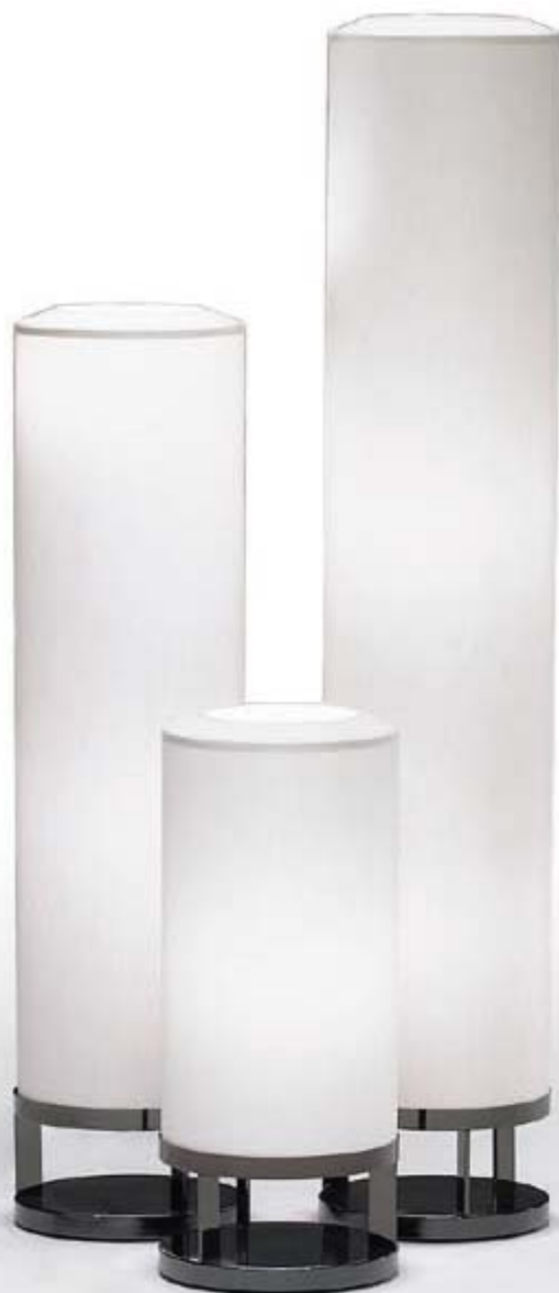
1 L470XB_(* ) + L470TB_(* ) + L470PB_(* ) table and stand lamps • Ivory